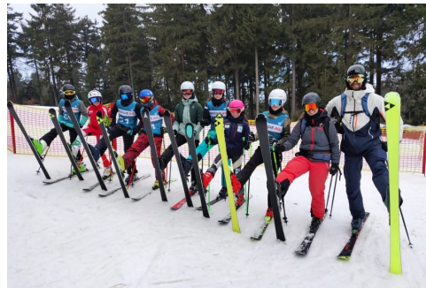
Schikurse und Sportwochen