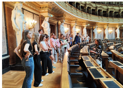
Projekte, Theaterbesuche, Kulturreisen