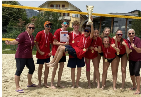
Bundes- und Landesmeister in vielen Sportarten, z.B. Volleyball, Tennis, Fußball, Leichtathletik,...