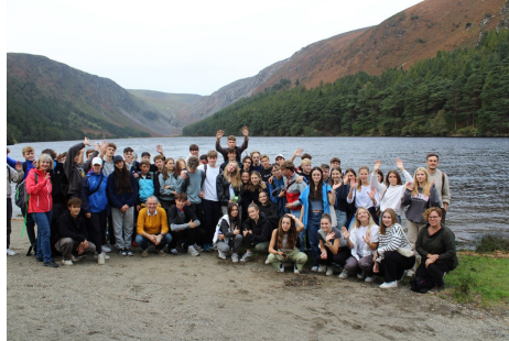
Sprachreisen, z.B. nach England oder Spanien