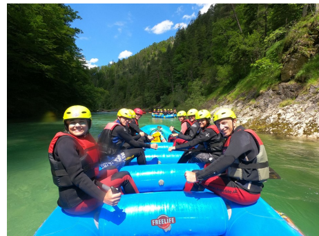
Sport in allen Facetten