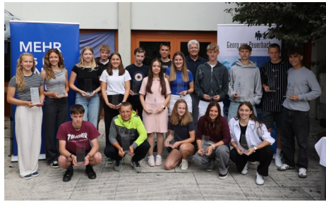
Georg-Awards für ausgezeichnete Schüler/innen